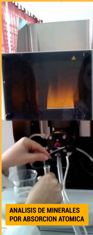
ANALISIS DE MINERALES POR ABSORCION ATOMICA