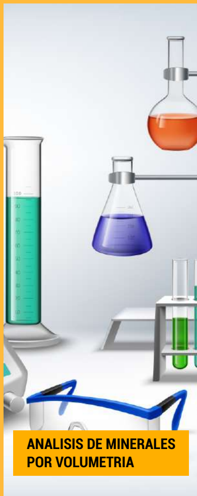
ANALISIS DE MINERALES POR VOLUMETRIA