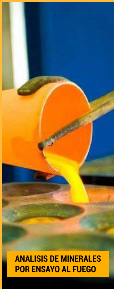
ANALISIS DE MINERALES POR ENSAYO AL FUEGO

AMV CONSULTORES Capacitación y Consultoría